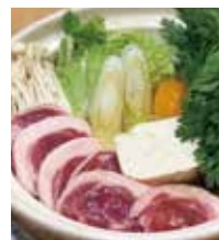
そば処 増林 砂場