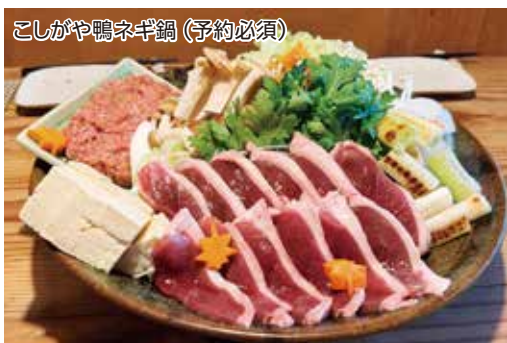
こしがや鴨ネギ鍋(予約必須)