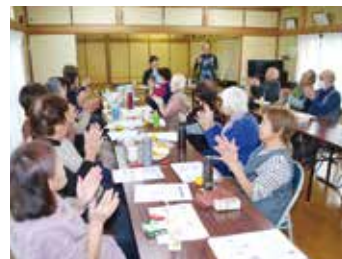
ふれあいサロンの様子