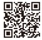
海外ブリーフィング サービス

海外70か所を超えるジェトロの海外事務所にて、一般経済事情や現地商習慣等ビジネス環境について、海外駐在員や専門のアドバイザーが現地の最新情報を説明します。海外出張の際、現地の「一般経済事情」を聞きたい、海外での商談前に「現地商習慣」を確認したい、「海外駐在員の生活環境」を聞きたいという企業様におすすめのサービスです。