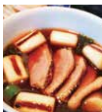
武蔵野うどん 越ヶ家