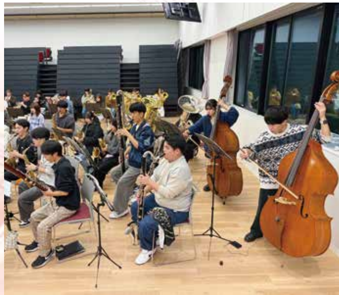
文教大学吹奏楽部の練習風景