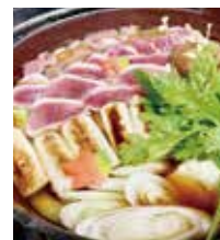
手打ちそば ふしみ