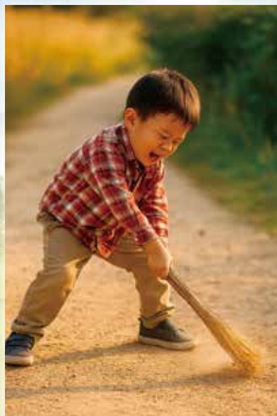
わらでっぽうで地面をたたく子供