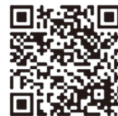
講座詳細(ガイドブック)