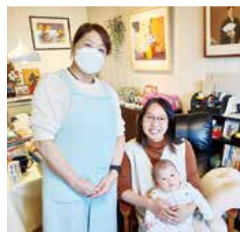
ほほえみサービス産後の支援