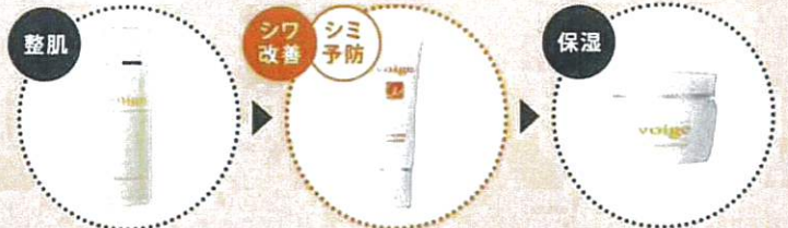
スキンローション 〈保湿化粧水〉 リンクルセラム 〈薬用シワ改善クリーム〉 スキンコンセントレート 〈保湿クリーム〉

ぜひ voige のスキンケアと一緒にお使いください! 保湿・シワ改善・シミ予防3つのケアが同時に叶います。