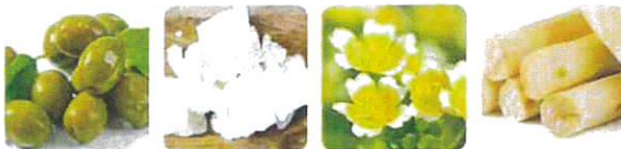
オリブ油 シア脂 メドウフォーム油 シュガースクワラン