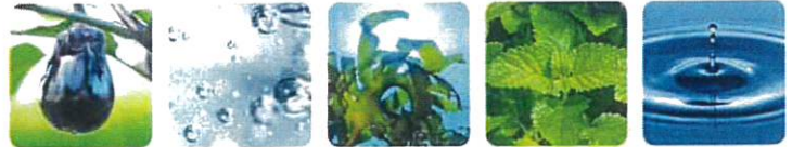
水ナス果実エキス 2種類のコラーゲン ※3 海藻エキス-1 メリッサエキス トリプルヒアルロン酸 ※4