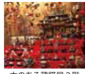
本のある蔵靴屋2階