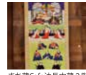
まち蔵Cafe油長内蔵2階