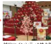
越谷ツインシティA棟2階

*無料着付けサービス(問合せ・予約 越谷市市民活動支援センター TEL: 048-969-2750)